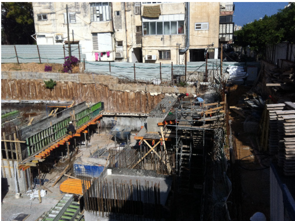
חזית צפונית - מערבית