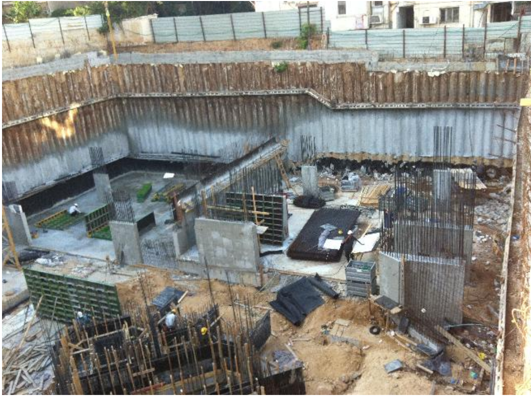
חזית צפון מערבית